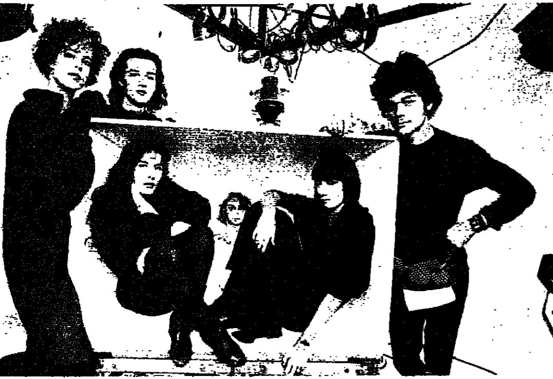
بيني وشنتال توماس وعزيمت وموديلات

الموضة، كما لم تخطر في بال احد، انها موضوع فيلم سينمائي، يشترك فيه عدد من «موهوبات»، وهن: موهوبي، والشانقة الكبيرة، امثال كستابلجك وغولتبييه واليا وكينزو وتوماس ومولغر. والفيلم الذي استعرضه قصر، ولا يطمح لانتاج اشكال الشاشات... هذا ما يؤكد، المخرج، وليام كلين، الذي صور تلك المصنوعات بدون تركيز، والهدف تسلط اضاءة جديدة على الموضة كطريقة استعمال. والفيلم الذي يشترك في انتاجه، كون، سوف تبثه القناة الاولى في التلفزيون الفرنسي. وليام كلين يعمل بلا انقطاع بهدف احراز العمل الذي تموله مؤسسة الازياء، ويستهدف التثدي على الجمالية المعاصرة في الزي واللون، وتلاحظ ان كلين، ينوع من الصن الميثولوجي، اراد خلق الموضة او تدميرها، غير سلسلة من الاستكشافات او المواقف المنفسية في اليوميات الواقعية او التصويرات الخشبية. الفيلم يتوزع على ١٢ مشهرا، وشدة استعراض الازياء قديمة وحديثة، ودخول اتي دوائر المصممين الكبار، ومواكبة للناس في الشوارع.